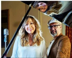
AuraMúsica lleva sus 'Trovadoras del amor' a Puertollano

El concierto se incluye en el programa "Vuelve la cultura Ciudad realmente segura" de la Diputación Provincial.